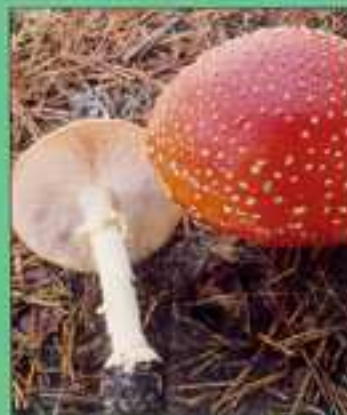
Amanita muscaria, seta mortal

Es una zona con gran variedad de setas, desde el apreciado y conocido niscal, pasando por el sabroso Boletus Edulis , hasta la rara y venenosa Cortinarius Orellanus .