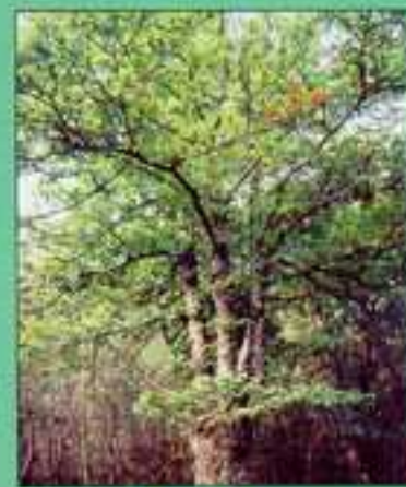
Castano junto a la garganta Majalobos

Lugares naturales de especial belleza son: "El Borbollón", "La Jabalinera", "El Jornillo", la garganta "Majalobos" y el castañar entre otros. "El Berrueco", con 1.815 m. sobre el nivel del mar, es el lugar más elevado de la sierra sotillana. Desde allí se puede ascender al punto más alto de la sierra en toda esta zona, "La Escusa", con 1.955 m.