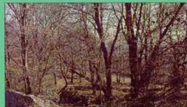
El bosque con la cálida luz de mayo ofrece buenas oportunidades para los aficionados a la fotografía.

Si lo que buscas son perspectivas de Sotillo, el cerro "Pinosa", ya en la parte baja, y el "Alto del Mancho", permiten observar el pueblo como parte importante de una espectacular Sierra de Gredos.